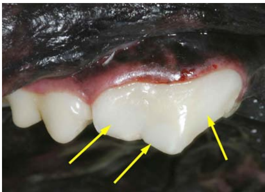
Zahnfarbene Füllungen (Pfeile) zum Verschluss der Kavitäten eines wurzelbehandelten Zahnes.

Nach Vorbehandlung des Schmelzes und Dentins wird eine Haftvermittlungsschicht aus dünnflüssigem Kunststoff aufgetragen, der die Anbindung des zähen Kunststofffüllmaterials an die Zahnoberfläche erst ermöglicht. Letztendlich wird dann das zahnfarbene Füllmaterial auf den Zahn aufgebracht, modelliert und mittels einer Polymerisationslampe ausgehärtet. Durch Schleifer und Polierer wird die Oberfläche so lange bearbeitet, bis sich keine Übergänge zwischen Zahnoberfläche und Füllung mehr nachweisen lassen. Die Füllung ist direkt nach Aushärten belastungsstabil. Die notwendige Haftung lässt sich wie bereits angesprochen nur bei ausreichend Schmelz bzw. gesunder umgebender Zahnhartsubstanz erzielen.