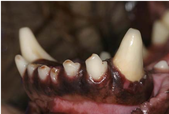
Keramikkrone am linken Unterkieferfangzahn.