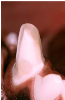
Kronenstumpf eines Unterkieferfangzahnes nach Präparation.

Um eine laborgefertigte Krone einsetzen zu können, muss der Zahnstumpf so präpariert werden, dass trotz fehlender untersichgehender Räume (vergleiche Füllung mit breiterem Boden als mechanische Verankerung) ausreichend Retention geschaffen wird. Dafür wird der Zahnstumpf bis zum Zahnfleischrand zirkulär abgeschliffen, der Zahnstumpf muss die Form eines Konus mit 3%iger Wandneigung erhalten. Zusätzliche Retentionshilfen wie die Präparation von Kästen erhöht die Oberfläche und damit die Retention und gewährleistet Rotationsstabilität. Eine „Querverbolzung“ mittels durch Zahn und Krone getriebenem Metallstift macht zwar ein Herausfallen unmöglich, es kommt im Bereich dieses Stiftes jedoch häufig zur neuerlichen Fraktur des ganzen Zahnes.