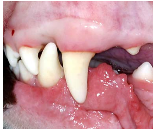
Füllungsversorgung des Defektes mit Komposit

Und hier ist der erste Knackpunkt der Versorgung eines Hundezahnes mit einer Kunststofffüllung. Anders als beim Menschen hat man viel weniger Schmelzfläche zur Anheftung des Kunststoffes zur Verfügung, weil der Schmelz des Hundes um ein Vielfaches dünner ist. Kleine Schmelzdefekte mit zirkulär vorhandenem gesunden Schmelz sind daher besser geeignet zur Versorgung mit einer Kunststofffüllung als große Verluste von Kronenanteilen,