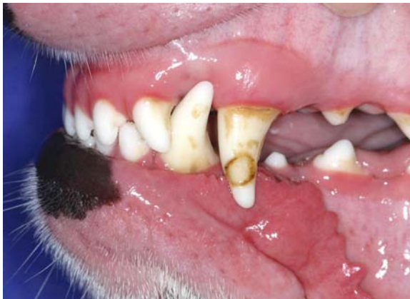
Schmelzhypoplasie am Oberkiefer-Fangzahn

Die Vorbereitung des Zahnes zur Aufnahme einer solchen Füllung umfasst die Präparation der umgebenen Zahnstruktur mit Schleif- oder Fräsinstrumenten. Beschädigte Zahnhartsubstanz wird hierbei entfernt, die Ränder der Füllung müssen in gesunde Zahnhartsubstanz gelegt werden. Je nach Tiefe des Defekts kann eine Schutzschicht für die Pulpa notwendig werden. Um für eine ausreichende Haftung des Füllmaterials am Zahn zu sorgen, wird sowohl der Schmelz als auch das Dentin vorbehandelt, wobei zumeist Säuren zum Einsatz kommen. Am Schmelz wird durch die Säure ein Mikrorelief erzeugt, in welchem sich der Kunststoff verkrallen kann. Die Anbindung am Dentin ist schwieriger, weil Dentin mehr lebendem Gewebe ähnelt als der Schmelz, welcher eher ein rein kristallines Gefüge darstellt.