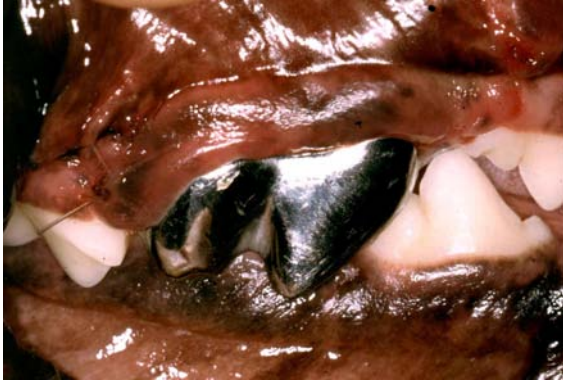
Metallkrone am Oberkiefer-Reißzahn.