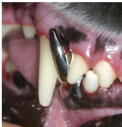
Versorgung des Stumpfes mit einer Metallkrone zur Wiederherstellung der Kronenform.

Nach Präparation des Zahnstumpfes wird Ober- und Unterkiefer mit einem Abdruckmaterial abgeformt. Im Labor werden diese Abdrücke (Negativform) mit Gips ausgegossen (Positivform). Auf dem Gipsmodell wird der zu ersetzende Zahn zunächst in Wachs modelliert, später dann in Metall umgesetzt. Auch im Labor sind hierbei auf viele Einzelheiten zu achten, um maximale Retention zu gewährleisten und Störkontakte der Metallkrone an anderen Zähnen zu vermeiden, die einen vorzeitigen Verlust der Krone verursachen könnten. Die Krone wird insbesondere etwas kürzer gestaltet als der ursprüngliche Zahn, um günstigere Hebelkräfte zu bekommen.