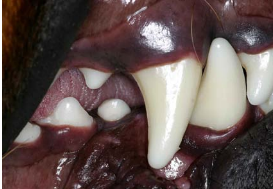
Implantatgetragene Keramikkrone am ersten Unterkieferprämolaren.

Macht eine Zahnfraktur die Erhaltung des Zahnes unmöglich, stellt das Einsetzen eines Implantates die letzte Versorgungsmöglichkeit dar. Nach Extraktion des Zahnes muss evtl. die knöcherne Ausheilung des Zahnfaches abgewartet oder ggf. sogar unterstützt werden, bis nach Vermessung des Kiefers ein geeignetes Implantat eingebracht werden kann. Bei geeignetem Zahnfach kann auch eine Sofortversorgung mit Implantat vorgenommen werden. Nach Einheilung des Primärteils im Kieferknochen wird ein Sekundärteil aufgeschraubt, welches letztendlich zur Aufnahme der „Zahnkrone“ dient. Der Ersatz von Zähnen durch ein Implantat beschränkt sich beim Hund jedoch auf Zähne, deren Anatomie und Belastung den jeweiligen Anforderungen des Implantats genügt. Der Ersatz eines extrahierten oder verlorenen Caninus ist daher in der Regel nicht möglich.