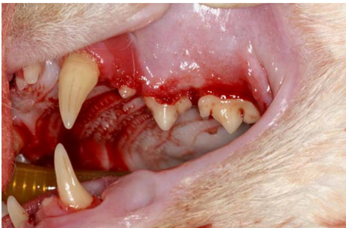
Zahnausbrüche an den Oberkieferbackenzähnen aufgrund von FORL.

Jede dritte Katze leidet an einer besonderen Form einer Zahnerkrankung, bei der es zur Auflösung von Zahnhartsubstanz kommt. In der Regel sind direkt mehrere Zähne betroffen. Es handelt sich um eine besonders schmerzhaftes Erkrankung, bei welcher der vitale Zahnerv sich plötzlich „im Freien“ befindet, weil die umliegende Zahnhartsubstanz durch aktivierte körpereigene Zellen (Odontoklasten) aufgelöst wurde.