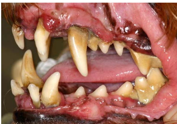
Gebiss mit Plaque, Zahnstein und Entzündung des Zahnfleisches.

Eine einmal etablierte Parodontitis führt bei Hund und Katze viel schneller als beim Menschen zu einer nicht mehr pflegbaren Situation. Trotz guter Mundhygiene durch den Besitzer ist ein einmal geschädigtes Gebiss viel schwieriger in der Pflege, als Zähne mit einem gesunden Parodont. Eine gute Prophylaxe ist somit x-mal besser, als eine verbesserte Pflege nach „Reparatur“. Ist eine Parodontitis bereits weit fortgeschritten, hilft häufig nur noch die Entfernung der betroffenen Zähne. Bei konsequentem Vorgehen können somit die noch erhaltungsfähigen Zähne gesund erhalten werden, gute Pflege vorausgesetzt.