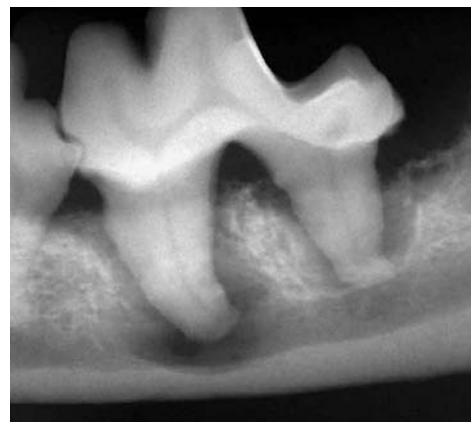
Im zugehörigen Röntgenbild zeigt sich die bereits im Kieferknochen ablaufende Entzündung mit Auflösung des Knochens um die Reisszahnwurzeln.