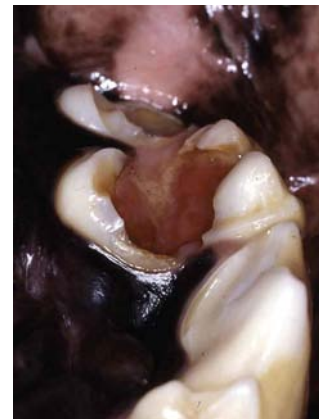
Kariöse Defekte des rechten und linken Oberkiefermolaren. Die kariösen Läsionen haben die Kauflächen vollständig zerstört und sind bis in die Pulpa penetriert, wo sie eine hochgradige Entzündung ausgelöst haben. Futterreste sind der Pulpa aufgelagert.