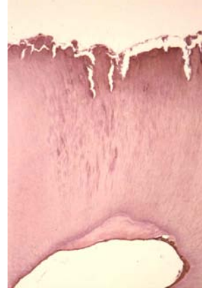
Die Pulpa versucht, sich durch die Bildung von Dentin gegen die eindringende Karies zu schützen.

Die Pulpa zeigt als Abwehr eine vermehrte Dentinbildung, um eine Schutzschicht zwischen sich und die angreifenden Bakterien zu bringen. Die Ausbreitung einer Karies findet beim Hund sehr schnell statt und nimmt in der Regel die gesamte Kaufläche ein. Häufig finden sich daher imposante Kariesläsionen, welche die vitale Pulpa freilegen. Vitalität der Pulpa bedeutet ebenfalls eine erhaltene Sensibilität, es sollte daher von einer entsprechenden Schmerzhaftigkeit ausgegangen werden.